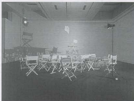
In alto: vista dell'installazione da Yvon Lambert, Parigi, 1992; sotto: "Teatro dell'opera" 1993