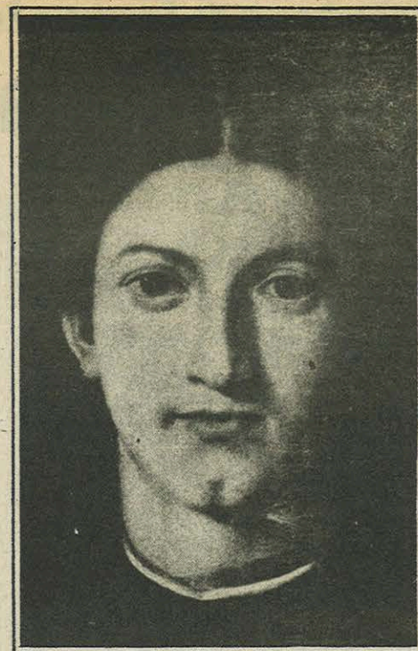
“Joven que mira a Lorenzo Lotto”, 1967. El tiempo abolido por la obra de arte, en un diálogo silencioso entre el pintor (1505) y el espectador (ahora).

La objetividad paradójica, según definió G. P., se basa en la autonomía temporal de la obra y la directa pero siempre referente lectura que induce al ser percibida.