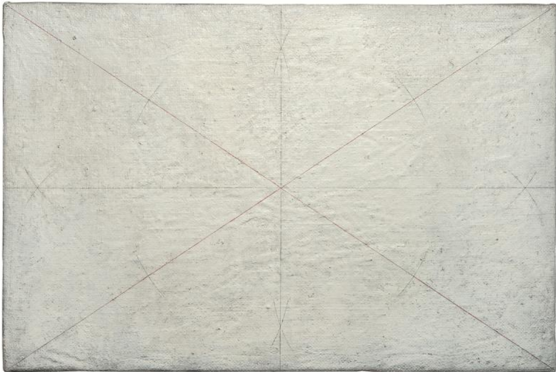
Disegno geometrico, 1960, ph Sarotto, Courtesy Fondazione Giulio e Anna Paolini, Torino.

Di questa vertigine metalinguistica, mi interessano due aspetti (il tipo di evoluzione che genera e l'ansia che questo stesso movimento possa arrestarsi), poiché sono proprio quelli che ritrovo nella personale di Giulio Paolini presso il Museo Novecento di Firenze : aspetti non certo trascurati dalla bibliografia sull'artista, ma che ora rivelano le loro implicazioni esistenziali e psicanalitiche – inaspettatamente, verrebbe da dire per un artista come Paolini, che si è sempre rispecchiato nella posizione di Italo Calvino contro i cedevoli biografismi e l'egolalia dell'arte.