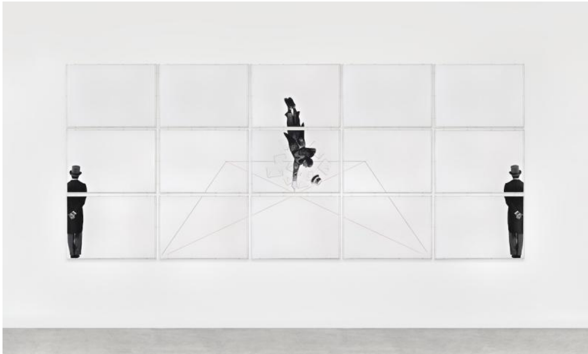
Caduta libera, 2018/2019, ph Fanuele, Courtesy Fondazione Giulio e Anna Paolini, Torino.

C'è un'opera di grande formato, in mostra, intitolata Caduta libera (suicida felice) , (2018-2019), che è un po' l'emblema di questa vertigine. Nella scheda di Bettina Della Casa e Maddalena Disch in catalogo si spiega che si tratta di "un acrobata a testa in giù, accompagnato da alcuni disegni in caduta libera", il quale "sembra trovare il suo punto di equilibrio nell'incrocio delle diagonali" che richiamano, a loro volta, Disegno geometrico . Nel momento della perdita di equilibrio, che scompagina fogli e opere, l'alter ego dell'artista compie il prodigio e fa perno sulla sua opera prima, che resta lì, inesauribile, a garantire il prosieguo della sua ricerca e la possibilità di allargare il gioco con altri metalinguaggi. Disegno geometrico diviene un esorcismo, compiuto in nome della sua potenzialità e inesauribilità, che consente al linguaggio di non concludersi, di restare sospeso in attesa della prossima mossa.