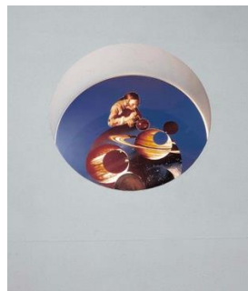
Fig. 13. Giulio Paolini, Belvedere , 1992, riproduzione fotografica su plexiglas, diametro 70 cm, opera non più esistente. © Giulio Paolini, foto Paolo Mussat Sartor. Courtesy Fondazione Anna e Giulio Paolini, Torino. Cliccare qui per un'immagine a più alta risoluzione.