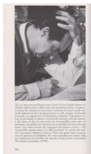
Fig. 12. La fotografia di Sebastião Salgado riprodotta in Album Calvino , a cura di Luca Baranelli ed Ernesto Ferrero (Milano: Arnoldo Mondadori Editore, 1995), n. 222, 260. Cliccare qui per un’immagine a più alta risoluzione.