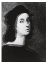
Fig. 10. Giulio Paolini, L'invenzione di Ingres , 1968, fotografia su tela emulsionata, 42 x 32 cm, Pinault Collection. Cliccare qui per un'immagine a più alta risoluzione.

deontologica e, dunque, solo per tale virtù, trascendentale in un senso latamente kantiano: un io capace di uno sforzo metacognitivo e appercettivo che superi i propri condizionamenti culturali e biopolitici. Soltanto grazie a questa astrazione, al riconoscersi in una figura metastorica, era possibile accogliere in essa, sovrapponendole, identità multiple ed eterogenee (Ingres, Raffaello, Saffo, Borges, Paolini, ecc.). Una riprova di questa posizione sta nel fatto che Paolini non operò mai sul registro delle fonti che prelevava; cioè, non ricorse mai alla caricatura, al pastiche , alla parodia: l'identità dell'io individuale, singolo, biografico non era in gioco in queste sostituzioni. Anzi, era la sua permutabilità la condizione precipua che, nel Novecento, l'autore scopriva di sé in quanto categoria, allo stesso tempo, storica nella sua fondazione e metastorica nella sua ambizione.