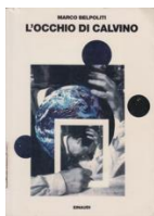
Fig. 4. Copertina di Marco Belpoliti, L'occhio di Calvino (Torino: Einaudi, 1996).

Nel complesso, la bibliografia recente ha insomma interpretato il dialogo fra Calvino e Paolini sotto la lente del problema autoriale, insistendo sulle comuni strategie di mascheramento, spersonalizzazione e moltiplicazione dell'autore. Questa traccia di lettura, per molti aspetti, trova un suo banco di prova nella copertina (fig. 4) che Giulio Paolini fu invitato a realizzare, a vent'anni di distanza dal suo incontro con Calvino, per il volume di Marco Belpoliti, L'occhio di Calvino , del 1996 (lo studioso, in effetti, era stato anche il primo a varare quel paragone, tra Paolini e lo scrittore, su cui si soffermerà la storiografia). 22