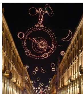
Fig. 14. Giulio Paolini, Palomar ; 1998, strutture di metallo, microlampadine racchiuse in tubi di plastica, cavi d'acciaio, dimensioni ambientali, Comune di Torino. © Giulio Paolini, foto Pino Falanga. Courtesy Fondazione Anna e Giulio Paolini, Torino. Cliccare qui per un'immagine a più alta risoluzione.